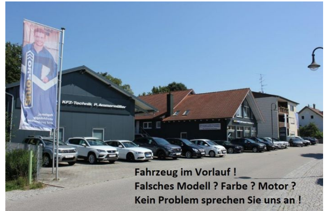
Bild dient nur zur Illustration und zeigt ggf. Aufpreispflichtige extras. Andere Farben und Ausstattungen lieferbar. Nicht alle Fahrzeuge passen auf unsere Homepage bitte erfragen Sie diese per Mail oder telefonisch !

Fahrzeug im Vorlauf ! Falsches Modell ? Farbe ? Motor ? Kein Problem sprechen Sie uns an !